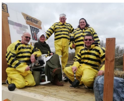
Voici nos Daltons accompagnés de M'ma Dalton

Malgré nos craintes, le soleil était au rendez-vous pour nous accompagner dans notre défilé. Merci à toutes les personnes venues déguisées pour se promener autour de notre char. Et surtout, encore un grand merci à nos bénévoles pour qui les idées pour l'année prochaine commencent à germer ! Pour ceux qui n'ont pas pu partager ce bon moment avec nous voici quelques photos de notre thème.